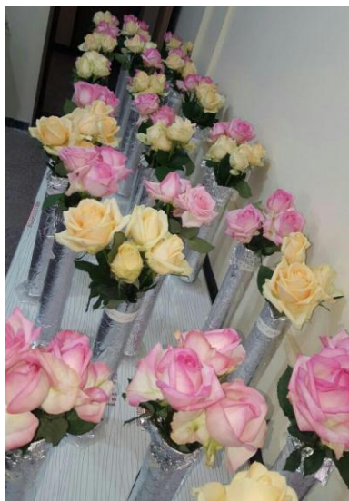
شکل ۱- تاثیر تیمارهای مختلف بر نگهداری ارقام پیچ و سوربیت رز شاخه بریده

سلوفان پوشانده شد. در تمام مدت آزمایش گل‌ها در شرایط کنترل شده با دمای 21 \pm 2 درجه سانتی‌گراد و رطوبت نسبی 65 \pm 5 درصد و شرایط نوری WM ۲۰ با دوره نوری ۱۲ ساعت روشنایی و ۱۲ ساعت تاریکی نگهداری شد.