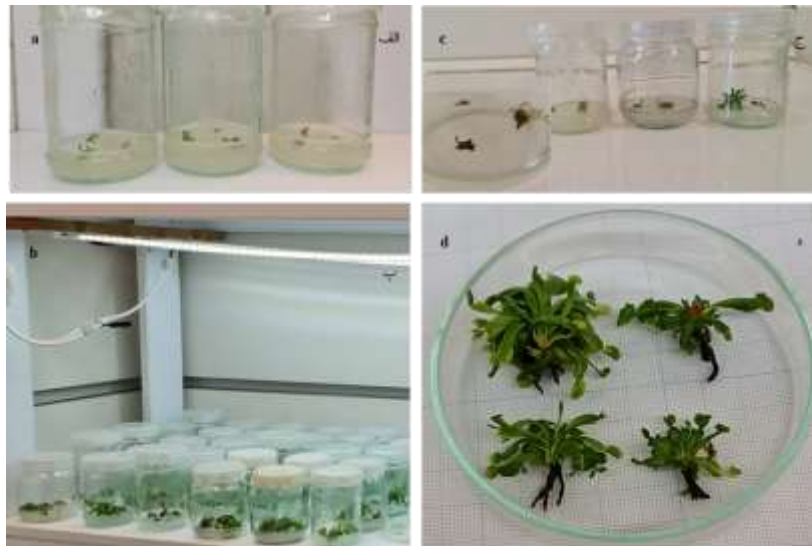
شکل ۱- مراحل مختلف افزایش گیاهچه ونوس حشره خوار در محیط کشت MS (الف) استقرار اولیه گیاهان؛ (ب) شرایط نگهداری گیاه؛ (ج) پاسخ گیاه به رشد و آلودگی و از بین رفتن گیاه (سیاه شدن بافت گیاه و عدم رشد در محیط)؛ (د) بررسی خصوصیات مورفولوژیک.

کشت بدون هورمون به مدت چهار هفته افزایش یافتند تا گیاهچه‌های یکسانی به دست آید. سپس گیاهچه‌ها در شرایط درون شیشه، با برگ غیر توسعه یافته و بدون ریشه (اندازه ۰/۳-۰/۲ میلی‌متر) به صورت تصادفی برای آزمایش انتخاب شدند. بدین منظور نمونه‌های افزایش یافته در محیط کشت موراشیگ و اسکوگ حاوی سه سطح بنزیل آدنین (۰/۱، ۰/۳ و ۰/۵ میلی‌گرم بر لیتر) همراه با ۰/۳٪ ساکارز حجمی/ وزنی و ۰/۸ درصد آگار کشت داده شدند. تمام محیط‌ها قبل از استریل در اتوکلاو در دمای ۱۲۱ درجه سلسیوس و ۱/۵ اتمسفر به مدت ۲۰ دقیقه، با HCl و NaOH یک نرمال در pH ۰/۲±۰/۸ تنظیم شدند. بعد از استریل و انتقال گیاهچه‌ها در زیر هود لامینار ایرفلو، همه کشت‌ها در دمای ۲۴ ± ۲ درجه سلسیوس زیر نور فلورسنت سفید خنک (۵۶ میکرومول در متر مربع بر ثانیه) با دوره نوری ۱۶ ساعت روشنایی و ۸ ساعت تاریکی قرار داده شدند. سپس به مدت ۲۲ هفته به نمونه‌ها اجازه رشد داده شد (شکل ۱). هر دو هفته نمونه‌ها جابجا شد تا شرایط برای تمام نمونه‌ها یکسان باشد. پس از گذشت ۱۵۵ روز صفاتی چون تعداد پینه‌های رویان‌زا، تعداد برگ، تعداد ریشه، درصد ریشه‌زایی، درصد باززایی (Pirooz et al., 2017)، کلروفیل و کارتنوئید مورد بررسی قرار گرفت.