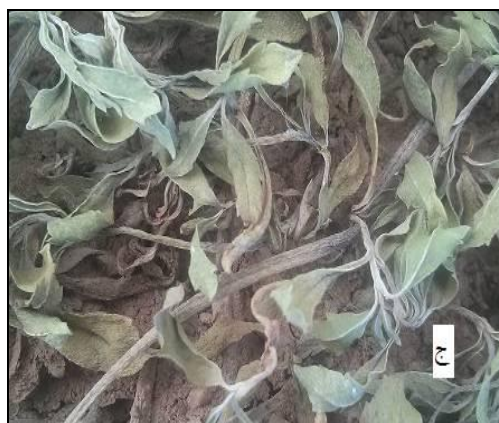
شکل ۲- دو گیاه پوششی مورد مطالعه بعد از اعمال تنش شوری الف "فیلا" و ب "فرانکنیا"، بعد از اعمال تنش خشکی ج "فیلا" و د "فرانکنیا"

طول شاخساره در فرانکنیا در اثر تیمارهای به کار رفته به طور معنی‌داری نسبت به فیلا کاهش نشان داد. نتایج برهمکنش سطوح آبیاری و سطوح شوری نشان داد که بیش‌ترین طول شاخساره مربوط به فیلا و تیمار ۱۰۰٪ ظرفیت مزرعه و شوری ۰/۵ دسی‌زیمنس بر متر و کم‌ترین آن مربوط به فرانکنیا در ۵۰٪ ظرفیت مزرعه و ۹ دسی‌زیمنس بر متر می‌باشد (جدول ۱).