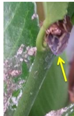
شکل ۴ - زنجبرک مرده در لابلای بوته شمشاد پنج روز بعد از سمپاشی با سایپرمترین

طی نمونه برداری های به عمل آمده از بوته های محلول پاشی شده، در تیمارهای سایپرمترین و ایمیداکلوپرید زنجبرک های مرده لابلای بوته های شمشاد مشاهده شدند (شکل ۴).