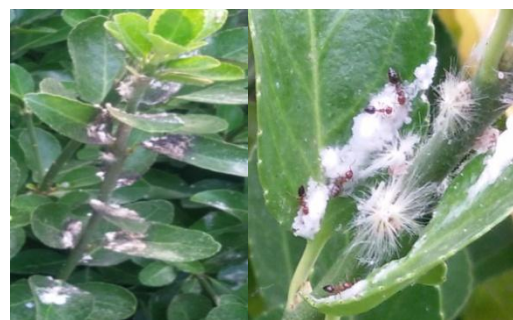
شکل ۲- تجمع مواد قندی و حضور مورچه‌ها در اثر فعالیت زنجرک Orosanga japonicus (سمت راست) و بوته شمشاد آلوده (سمت چپ)