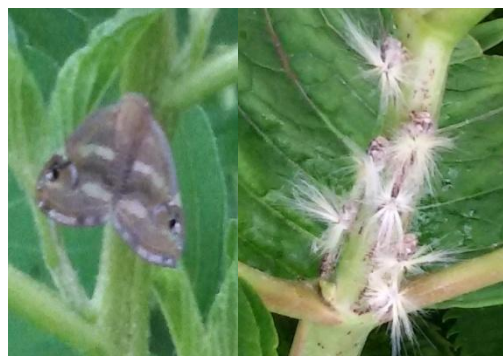
شکل ۱- پوره‌ها (سمت راست) و حشره کامل (سمت چپ) زنجرک Orosanga japonicus

سایپرمتترین و حشره‌کش گیاهی پالیزین علیه زنجرک O. japonicus مورد ارزیابی قرار گرفتند.