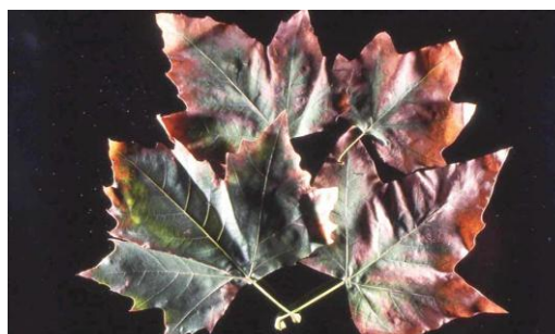
شکل ۳- اثرات استفاده از نمک برای ذوب یخ بصورت ریزی و قرمزی برگ‌ها در اوایل فصل (Rose & Webber 2011).

سوابق پژوهشی نشان داد تأمین نیتروژن مورد نیاز به همراه آب کافی از مهمترین عوامل تولید و نگهداری این درختان بشمار می‌رود. مصرف انواع کودهای شیمیایی و بررسی جذب عناصر نشان داد که نیتروژن در ترتیب نیاز غذایی چنار مهمترین عنصر مورد نیاز است (Wood et al., 1977). تزچاپلنسکی و همکاران (۱۹۹۱)، میگروئت و همکاران (۱۹۹۴) و مرینو (۲۰۰۸) نیز نتایج مشابهی را گزارش کرده‌اند.