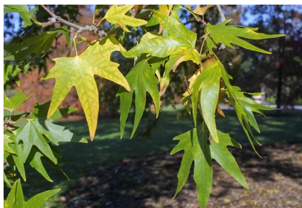
شکل ۱- علائم تنش آب در اثر آبیاری نامنظم و ایجاد اختلال تغذیه‌ای در برگ چنار (Hull 2011).

۱- تنش آبی در اثر آبیاری نامنظم و ایجاد اختلال تغذیه‌ای به عنوان یکی از عوامل خزان زودرس و مرگ و میر درختان در شهر تهران ذکر شده است (شکل ۱). گرم شدن اقلیم در سال‌های اخیر و گرمای شبانه در فصل تابستان باعث بروز مشکلاتی از جمله: مکش شدید برگ‌ها و عدم تأمین آب توسط ریشه، عدم امکان جبران کمبود آب در طول شب، هوا کشیدن آوندها در نتیجه کمبود آب و قطع جریان پیوسته شیره، غلیظ شدن شیره افزایش کلسیم و برهم خوردن تعادل یونی و اسمزی که منجر به بروز کمبودهای دیگر از جمله کمبود آهن می‌گردد، سفت شدن خاک تحت تاثیر خشکی و کاهش نفوذ پذیری ریشه و همچنین افزایش شوری آب و خاک می‌شود (زهتابیان و فرشی ۱۳۷۸، محمدی گلرنگ ۱۳۸۵، شبان و همکاران ۱۳۸۸). کافی و بحرینی (۱۳۸۴) گزارش نمودند بین عارضه خزان زودرس درختان چنار و افزایش آهک در خاک همبستگی وجود دارد. ایشان عوامل اکولوژیک بویژه فاکتورهای اقلیمی و شرایط آب و هوایی و مدیریت آبیاری در سال‌های گذشته را موثر دانستند.