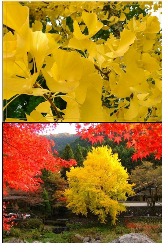
شکل ۴- تغییر رنگ پاییزی در برگ‌های ژینکو به دلیل وجود کارتنوئیدها

(Ougham et al. 2005; Matile 2000). نسبت کارتنوئیدها با گونه گیاهی، سن برگ و عوامل محیطی تغییر می‌کند. این رنگیزه‌ها به طور عمده رنگ‌های زرد و نارنجی را ایجاد می‌کنند (Ougham et al. 2005).