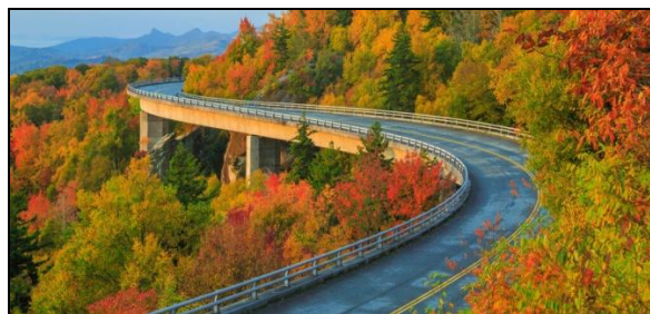
شکل ۱- تغییر رنگ برگ‌ها در پاییز و ایجاد پردیسه‌های زیبا در مناطق معتدله و سردسیر