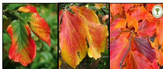
شکل ۳- تغییر رنگ در برگ‌های انجیلی یا درخت آهن از گونه های انحصاری جنگل‌های شمال ایران

پیری برگ‌ها و تغییر رنگ آنها یک فرایند بسیار برنامه ریزی شده، سازمان یافته و در عین حال پیچیده است که به طور تنگاتنگی تحت تاثیر عوامل ژنتیکی و محیطی است (Keskitalo et al. 2005; Wen et al. 2015). برهمکنشی از چندین عامل مانند ژنتیک، مرحله رشد و نمو گیاه، طول روز، دما، نور، پرتو فرابنفش، رطوبت، ارتفاع از سطح دریا، هورمون‌های گیاهی، کربوهیدرات‌ها، مواد معدنی، ترکیب رنگدانه‌ها، رنگدانه‌های کمکی، سن برگ، یون‌های فلزی، pH و غیره تغییرات رنگ برگ را تعیین می‌کند (Davies 2004; Ougham et al. 2005; Tanaka et al. 2008; Mlodzinska 2009; Archetti et al. 2009). همچنین، تغییر رنگ برگ نه تنها از درختی به درخت دیگر متفاوت است، بلکه حتی بین برگ‌های روی یک شاخه هم تفاوت دارد. در برخی از درختان، حتی در بین بخش‌های یک برگ هم تغییر رنگ دیده می‌شود (Archetti & Brown 2004). در شکل ۳، در روند تغییر رنگ برگ در انجیلی یا درخت آهن که از گونه‌های بومی و انحصاری شمال ایران است، دیده می‌شود.