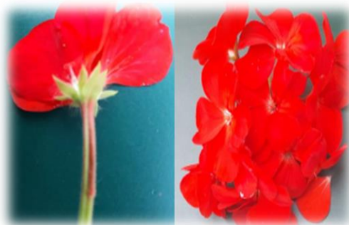
شکل ۱- گل های گیاه شمعدانی رقم Horizon Red.