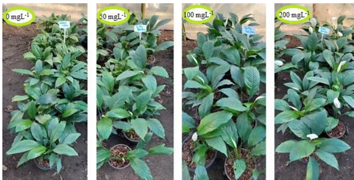
شکل ۳- گیاهان محلول پاشی شده با سطوح مختلف جیبرلیک اسید.