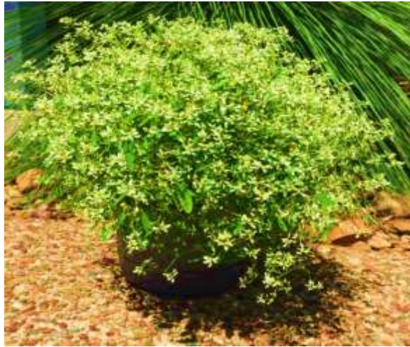
نگاره ۱. تصویر گونه E. hypericifolia مورد استفاده در پرسشنامه.