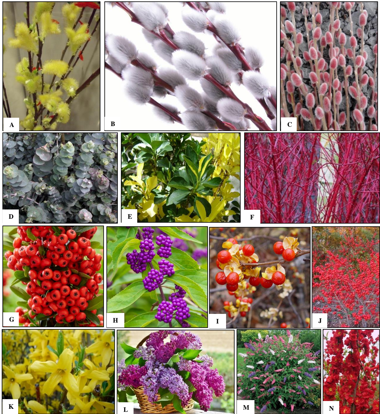
شکل ۱. گونه‌های جنس بید برای شاخساره بریدنی (A، B و C). اکالیپتوس (D). شمشاد ژاپنی (E). زغال‌اخته (F)، پیراکانثا (G)، کالیکارپا (H)، تلخ و شیرین (I)، خاس (J)، یاس زرد (K)، یاس بنفش (L)، دم‌موشی (M) و به‌ژاپنی (N).