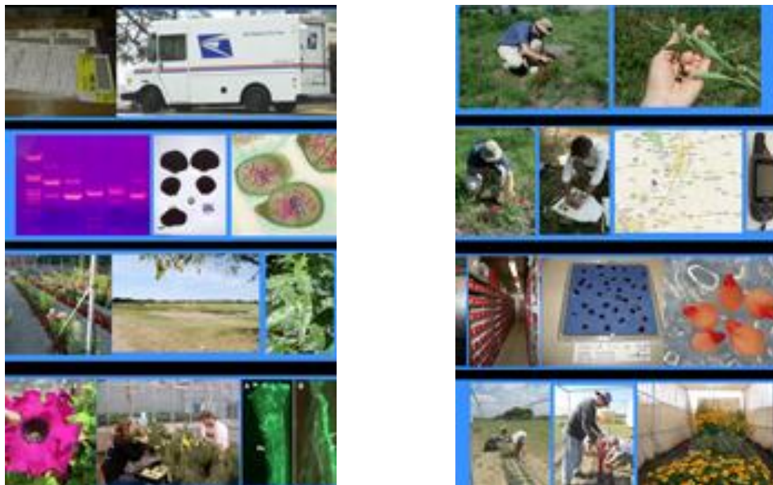
شکل ۳- مراحل مختلف برنامه حفاظت از منابع ژنتیکی. شکل سمت راست: به ترتیب از بالا به پایین: جمع آوری، مستندسازی، نگهداری، بازرایی. شکل سمت چپ: به ترتیب از بالا به پایین: توزیع، دسته بندی، ارزیابی، اصلاح

همان طور که ذکر شد بانک ژن از مهمترین روش‌ها در حفظ ژرم پلاسماها است. فرآیند بانک ژن، به عنوان جزئی از حفاظت ex situ مستلزم دانش در بسیاری از زمینه‌های بیولوژیکی و علوم فیزیکی از جمله گیاهشناسی، طبقه‌بندی، ژنتیک و فیزیولوژیکی گیاهی، بیوشیمی، تکنولوژی بذری، پاتولوژی گیاهی، حشره شناسی، علوم علف هرز، اتوماسیون اداری، علوم کامپیوتری، مهندسی کشاورزی و غیره می‌باشد. یک بانک ژن کارآمد، مرکزی است که اعضای آن بتوانند بذرهایی با بالاترین کیفیت را (از نظر ژنتیکی، فیزیولوژیکی و فیزیکی) برای انبارداری تامین کنند. این فرآیند به افزایش زمان بین دوره‌های بازرایی کمک می‌کند. در هر دوره تکثیر و ذخیره بذرها ممکن است برخی تغییرات در ترکیب ژنتیکی این مجموعه‌های بذری رخ دهد که منجر به از دست رفتن برخی ژن‌ها و در نهایت باعث فرسایش ژنتیکی در بانک‌های ژن شود. برای کاهش این پدیده ضروری است که بانک ژن و وسایل آزمایشگاهی مختلف، فرآیند خشک