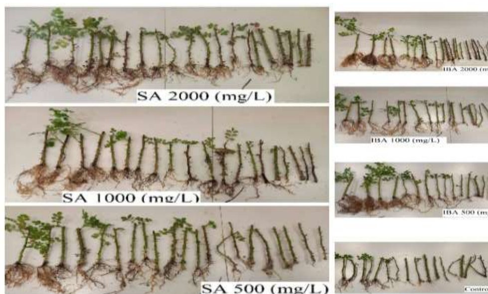
شکل ۲. قلمه‌های نسترن زرد ( Rosa foetida Herrm. ) تحت تیمار تنظیم کننده‌های رشد گیاهی اسید سالیسیلیک و ایندول بوتیریک اسید سه ماه پس از کشت.