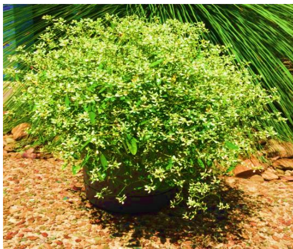
نگاره ۱. تصویر گونه E. hypericifolia مورد استفاده در پرسشنامه.