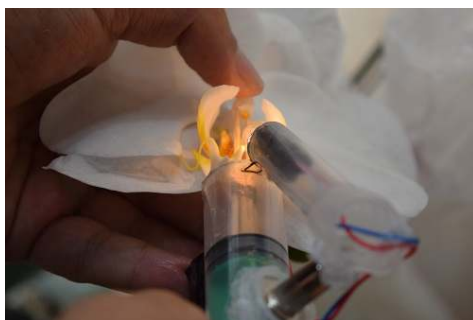
شکل ۱- سرنگ مایه زنی ارکید ثبت شده در اداره ثبت اختراعات.

Chen، پژوهش جاری در سال ۱۳۹۸ در آزمایشگاه کشت بافت دانشکده کشاورزی دانشگاه زنجان اجرا شد. پنج رقم ارکید فالانوپسیس شامل Memphis، Dubrovnik، Bucharest، Andorra و Nottingham از گلخانه‌ای در