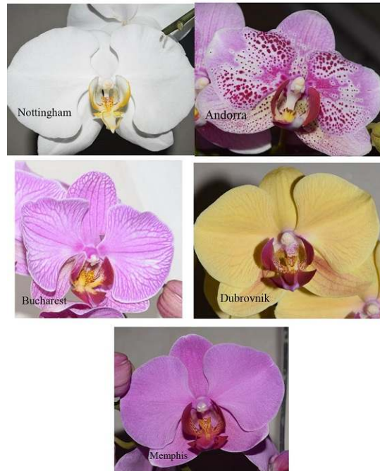
شکل ۳- ارقام فالانوپسیس مورد استفاده در آزمایش.

سقط شده تعیین شدند (شکل ۲). درصد تنژگی از نسبت شمار بذره‌های تنژیده به شمار کل بذرها به دست آمد. نتایج بررسی آزمون‌های معنی‌داری گروه‌بندی ویژگی‌های تنژگی