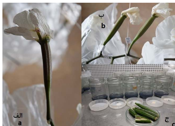
شکل ۲- تشکیل کپسول (الف و ب) و کشت بذرها پس از گندزدایی در محیط کشت (ج).

سلسیوس زیر نور سفید فلورسنت (۵۶ میکرو مول بر مترمربع بر ثانیه) با دوره نوری ۱۶ ساعت قرار داده شدند. روش کاشت بذرها پس از گندردایی کپسول بدین صورت بود که در زیر هود کشت بافت با انبرک بخشی از بذرها در سطح محیط کشت Chen به صورت کامل پخش شد