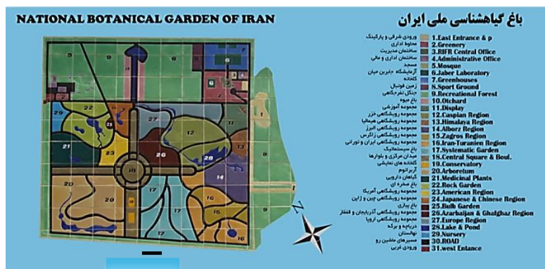
شکل ۱- نقشه باغ گیاه‌شناسی ملی ایران و جایگاه رویشگاه البرز (شماره ۱۴، بنفش رنگ).

از استقرار گیاهان، ریخت شناسی و چگونگی رفتار آن‌ها در رویشگاه جدید بررسی می‌شود. در نتیجه گونه‌هایی که به باغ انتقال یافته‌اند همیشه زیر نظر می‌باشند. از مهم‌ترین مجموعه‌های باغ می‌توان به بخش‌های ایران-تورانی، البرز، هیرکانی، زاگرس، باغ میوه، باغ سیستماتیک و نمایشی اشاره کرد (شکل ۱). با توجه به این که رویشگاه البرز جنوبی شامل منطقه تهران و اطراف آن می‌باشد، از این رو گونه‌هایی که در رویشگاه باغ گیاه شناسی سازگار شده اند و دارای ویژگی زینتی می‌باشند می‌توانند گزینه‌های خوبی برای کاشت در فضای سبز شهر تهران بدون آزمون و خطا باشند (شکل ۲). گونه‌های معرفی شده در این پژوهش از بین صدها گونه‌ای می‌باشند که با آزمون و خطا وارد رویشگاه شده و استقرار