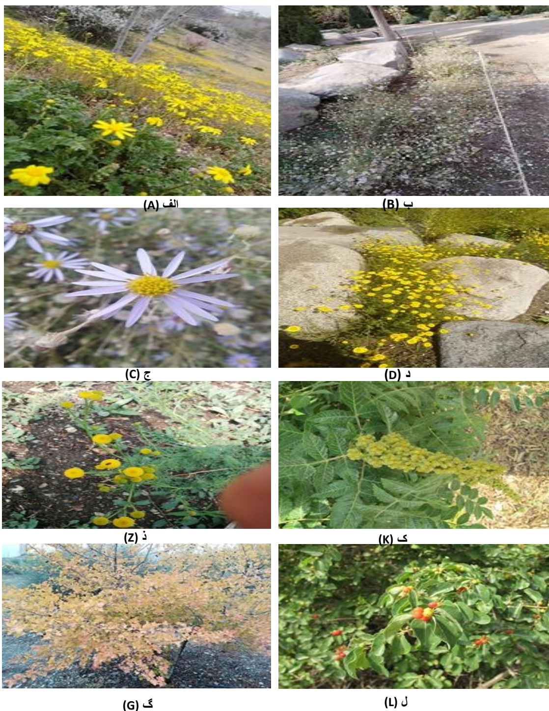
شکل ۳- الف: Senecio vernalis ب و ج: Heteropappus altaicus د: Tanacetum parthenium ز: Triplospermum disciforme

هرچند گونه‌های مورد بررسی تمام گونه‌های موجود در رویشگاه البرز نیستند و گوناگونی بالاتری در این