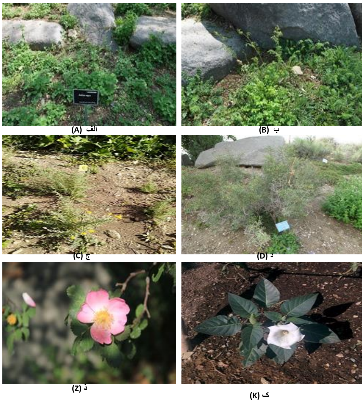
شکل ۵- الف: Ballota nigra ، ب: Sanguisorba minor ، ج: Achillea vermicularis ، د: Amygdalus lycioides ، ز: Rosa canina ، ک: Daturea stramonium .